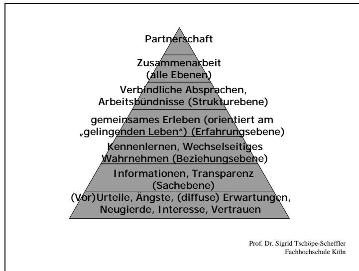
„Pyramide der Partnerschaft“

„Partnerschaft“ kann sich nur auf der Basis miteinander gemachter Erfahrungen Schritt für Schritt aufbauen. Dazu gehört notwendigerweise der offene auch konfliktbereite Umgang mit (Vor-) Urteilen, Enttäuschungen etc.